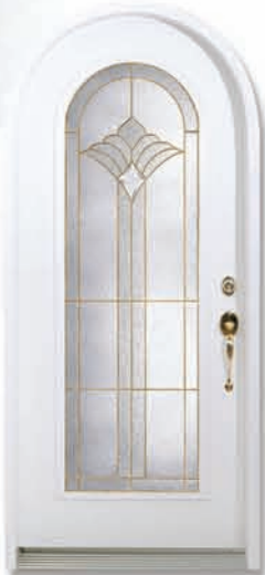
CAL 106R (23 X 65) Laiton