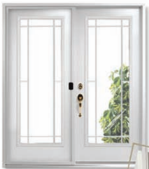
Jardin A13 Contour (21 x 65)

Un modèle à la fois raffiné et classique, idéal pour admirer le paysage