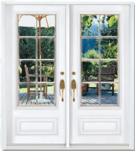
PJ. 2000 114 BCL-ML (24 X 10) Laiton