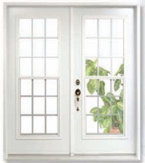
A14 Cain Ventilé (21 x 65)

Une excellente alternative à la porte jardin. Permet un meilleur contrôle de la ventilation.