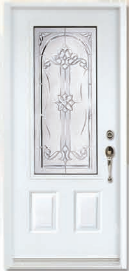
KIR 104 (23 X 49)