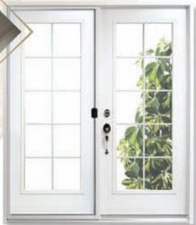
Jardin Cain 10 (21 x 65)