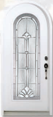
MHD-109-778 (23 X 65) Zinc

Cette porte à la forme si différente conviendra au remplacement de votre porte de bois ou à une nouvelle construction.