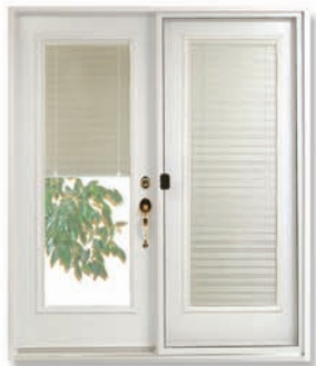
A19 Vénitienne 2 actions (21 X 65)

Aussi disponible, à un moindre coût le store à simple action qui ne fait que pivoter.