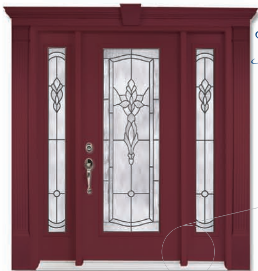
ARA 107 Patiné (8 X 65)