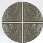
Verre biseauté glupo